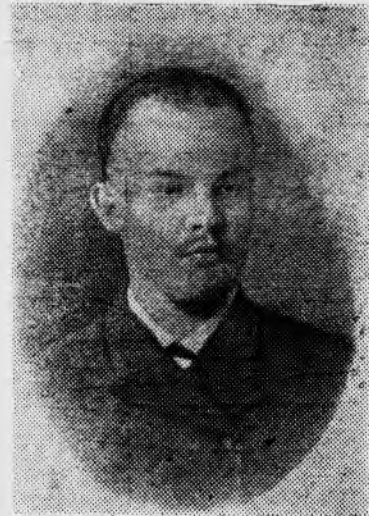
В. И. Ленин в студенческие годы. Самара. 1890 г.

Петербург — крупный промышленный центр, где были сосредоточены большие массы пролетариата.